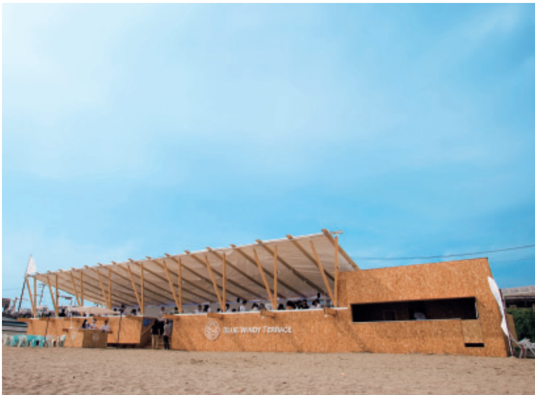
(右) 空と海の色が存分に楽しめる。(左上) 建物内は風が感じられる開放的な作り。(左下) テラスでは美しい眺めと心地よい風が味わえる。